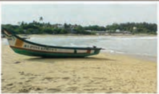
Crocodile bank and Kovalam Beach