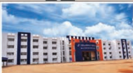
Leading Schools and Colleges