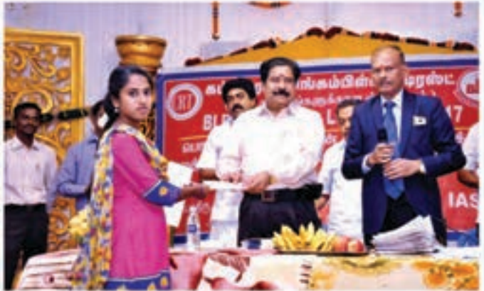
Educational donations distributed by N.Veknatachalam, IAS Collector, Theni District