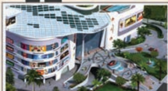
Malls and Cinemas