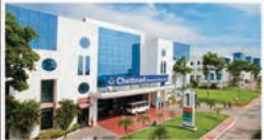
Chettinad Health City Hospital