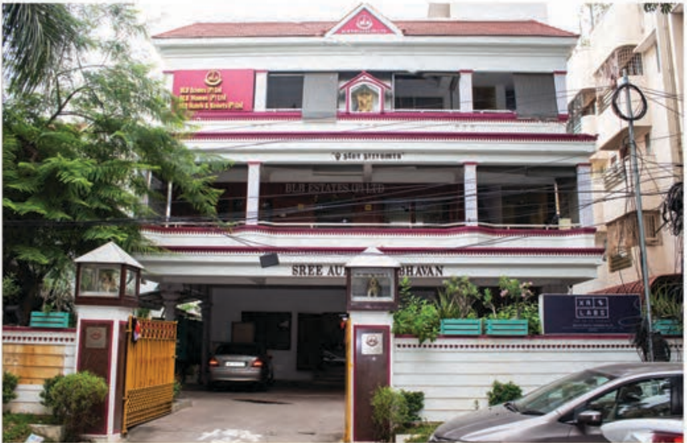
Office Building of BLB Estates at 21, Chinniah Street, Opp. Kamarajar House, T.Nagar, Chennai - 17